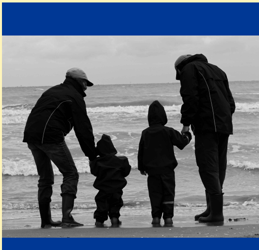
UNIDOS Y FELICES